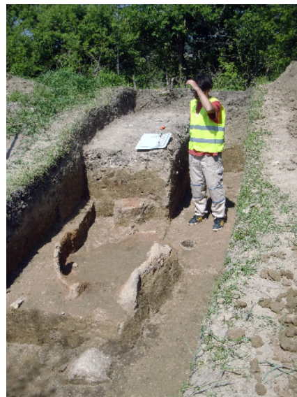
Остатак нећи, VII век