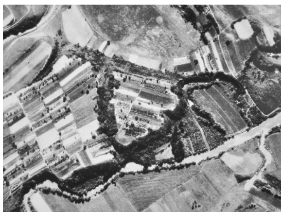
Авио снимак дупљајског Града; плато, непосредна околина, корито Караша