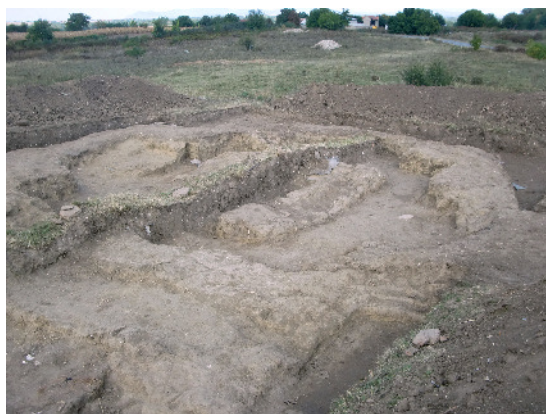
Остатак објекта нејасне намене, по аутору ископавања основа цркве VII век